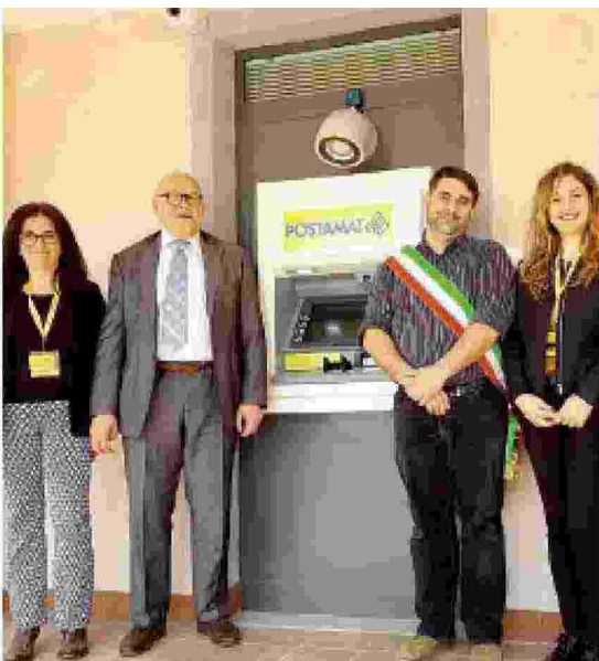
L'inaugurazione del Postamat a Mornese