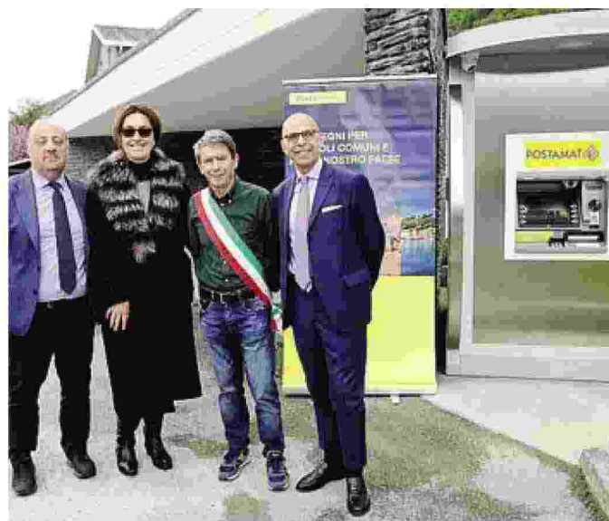
Autorità ed esponenti di Poste italiane all'inaugurazione

Lo sportello è stato installato all'incrocio tra la provinciale e via Vittorio Veneto