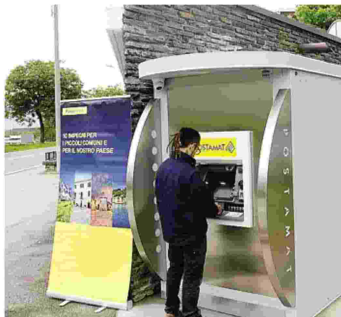
Subito attivo lo sportello Postamat inaugurato ieri a Cedrasco

Il Postamat consente, come detto, di prelevare contanti con le carte di Poste e dei maggiori circuiti internazionali, di effettuare ricariche telefoniche e delle carte Postepay, di pagare le principali utenze e i bollettini di conto corrente po-