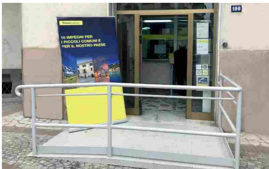
L'ufficio postale di Martone