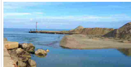
cassano all'ionio, comunicati stampa, news, politica

Illustrata in Commissione consiliare sport la manifestazione "Campioni di vita e di sport" in programma dal 10 al 12 maggio redazione 06/05/2019 16:05