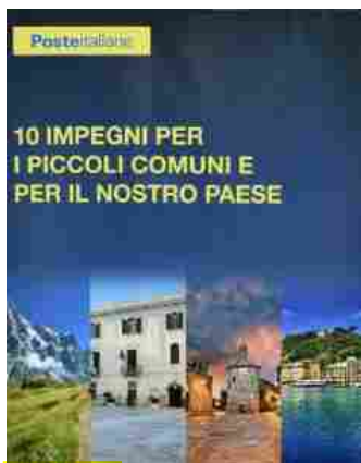
Poste Italiane abbatte le barriere architettoniche