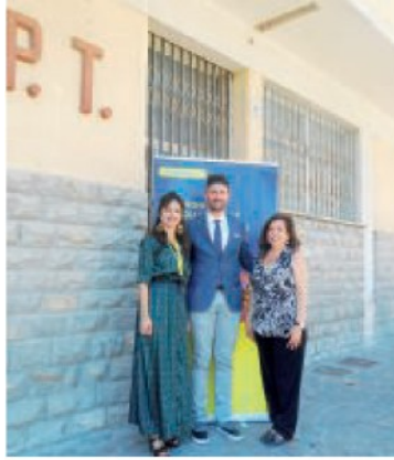
L'ufficio postale acquistato dal Comune