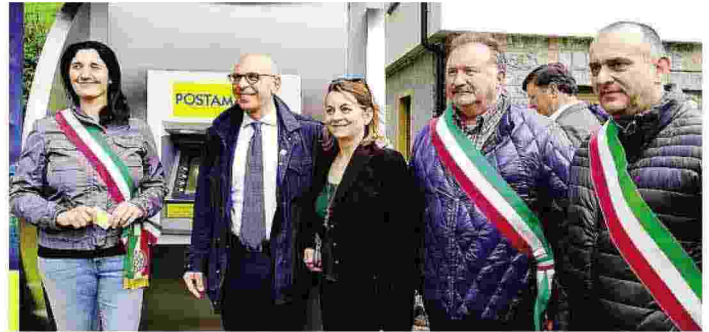
L'inaugurazione dei Postamat a Piazzolo: il servizio sarà attivo 24 ore su 24