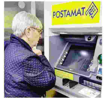
Le prime operazioni allo sportello

■ A breve lo stesso servizio in altri 21 centri orobici, da Blello a Berzo San Fermo