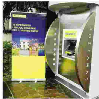
L'Atm è dotato di dispositivo anti clonazione carte