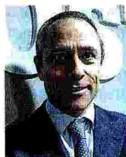
Matteo Del Fante. Amministratore delegato di Poste italiane

Con l'installazione dei primi due nuovi sportelli automatici Atm Postamat nei Comuni di Cassiglio e Piazzolo (Bergamo), ha preso il via il piano per estendere la rete capillare di Poste Italiane ai 254 Comuni con meno di 5mila abitanti non direttamente presidiati da un ufficio postale, come comunica una nota di Poste italiane. Le installazioni sono parte di un più ampio progetto che ha l'obiettivo di soddisfare al meglio le esigenze