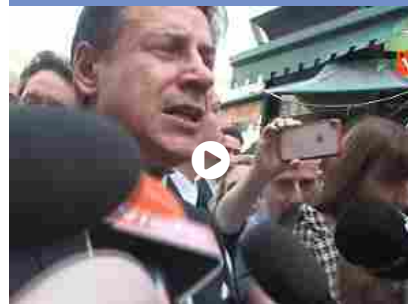
Il premier Conte si ribella a Salvini (e di Maio): "Non sono mai stato un passacarte"